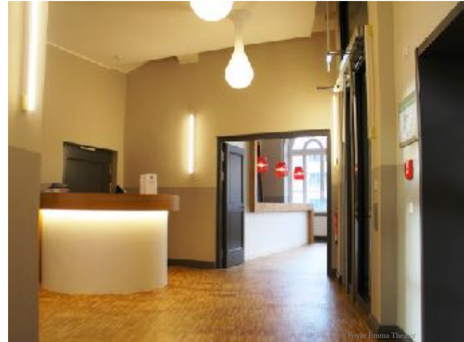
Foyer Emma Theater

Planung, Gestaltung und Umsetzung der Ersatzspielstätte des Schlosstheaters, der Residenzhalle , auf dem Gelände einer ehemaligen Kaserne. Die Residenzhalle diente als Ersatzspielstätte für zwei Spielzeiten während des Theaterneubaus zwischen Juni 2010 bis Juli 2012